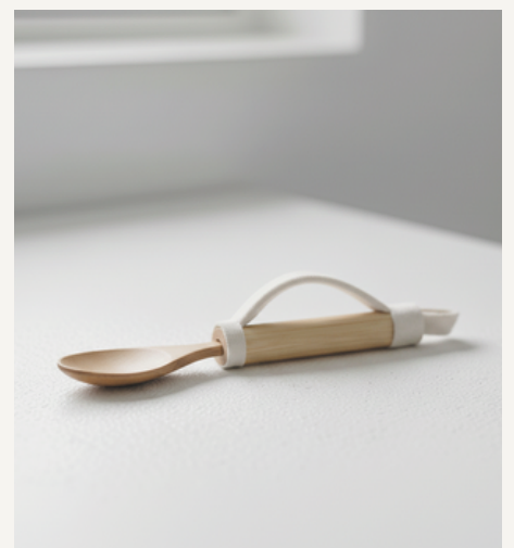
ALAT BANTU MAKAN (SENDOK & GARPU)