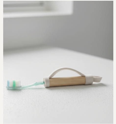
ALAT BANTU KEBERSIHAN DIRI (SIKAT GIGI)

Alat bantu Senandung Asa tersedia dalam beberapa varian yang disesuaikan dengan aktivitas harian pengguna. Seluruh varian dirancang dengan prinsip modular, aman, dan ramah sensorik, serta dapat digunakan dengan pendampingan caregiver.