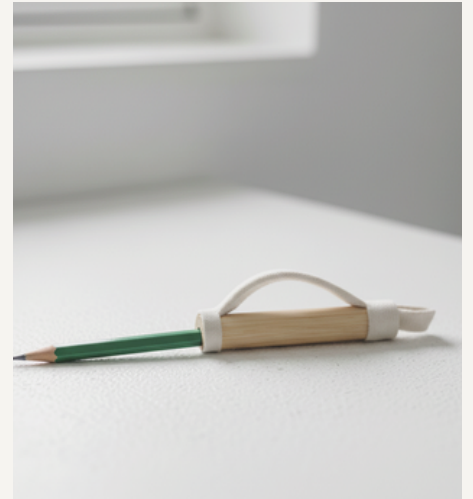
ALAT BANTU MENULIS (PULPEN & PENSIL)